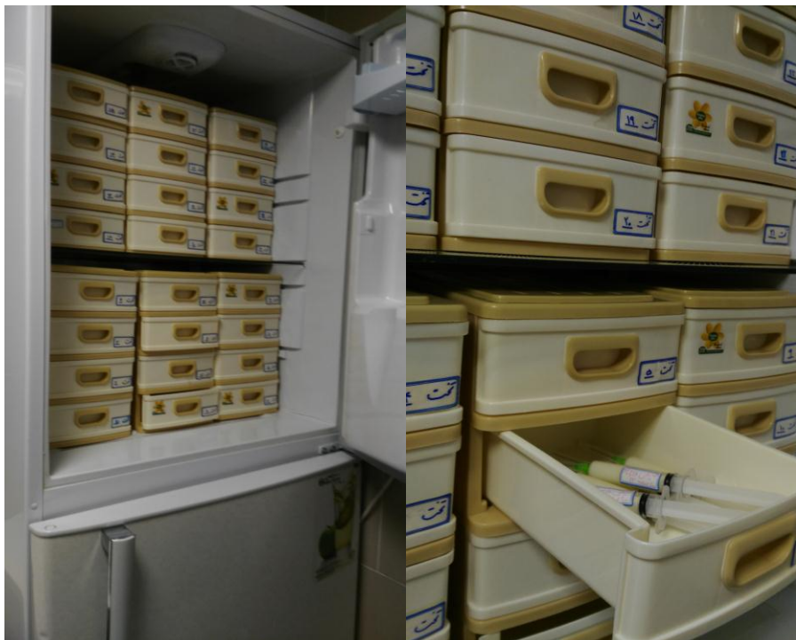
تصویر 5. یخچال و فریزر مخصوص نگهداری شیرهای دوشیده شده