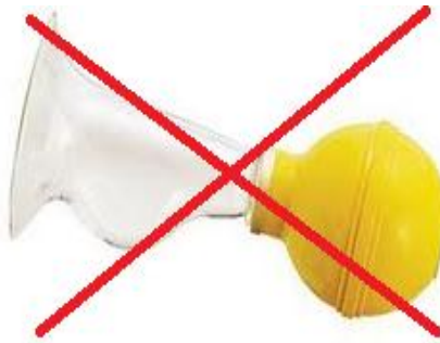
تصویر 1. شیردوش دستی بوق دوچرخه‌ای

این نوع شیردوش توصیه نمی‌شود چون تمیز کردن آن بسیار مشکل است و خطر رشد میکروب و آلودگی شیر وجود دارد. همچنین قدرت مکش آن مناسب نیست و باعث زخم شدن نوک سینه مادر می‌شود.