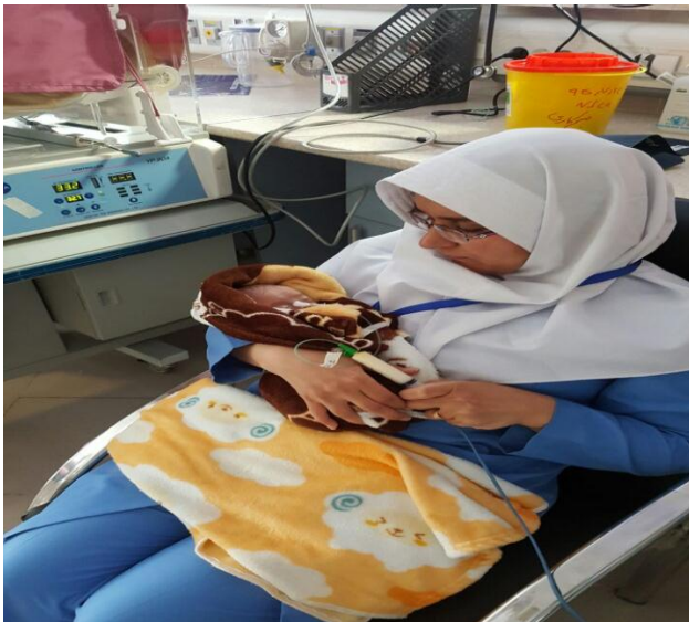
تصویر 6. پرستار نوزاد در حال تغذیه نوزاد با شیر دوشیده شده