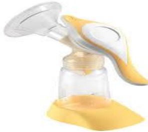
تصویر 3. شیردوش دستی اهرم دار

استفاده از این شیردوش‌ها راحت‌تر است ولی قدرت مکش آنها از شیردوش‌های سیلندری کمتر است.