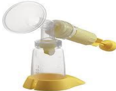
تصویر 2. شیردوش دستی سیلندری (رفت و برگشتی)

برای دوشیدن بهتر و تولید شیر بیشتر از شیردوش‌های دستی سیلندری که حرکت رفت و برگشتی دارد استفاده کنید.