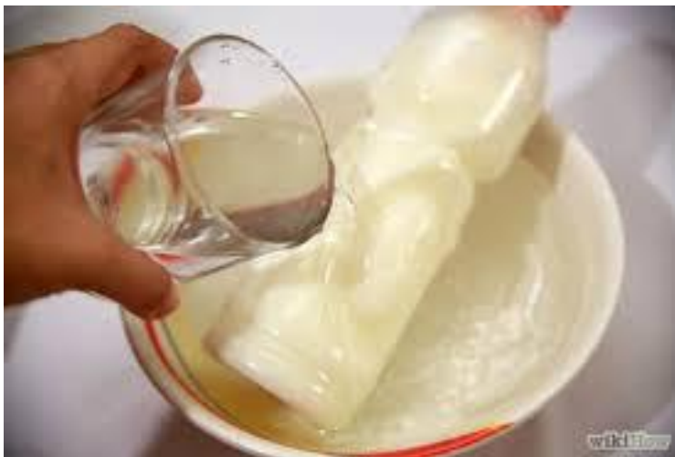
تصویر 7. ذوب کردن شیر یخ زده با آب ولرم